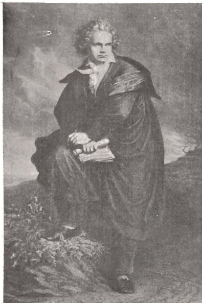
Luis Van Beethoven